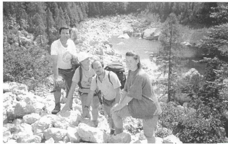
Pri Sedmerih jezerih med sestopom s Triglava avgusta 1990 v veseli družbi članov Planinskega društva RTV Ljubljana.